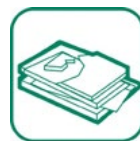
Plaques de plâtre