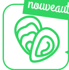
Collecte de coquilles d'huîtres*