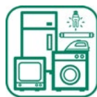
Déchets électriques et électroniques