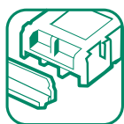
Polystyrène Seulement au Givre et à Saint-Vincent/Graon