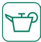
Huiles de vidange