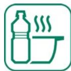
Huiles de friture